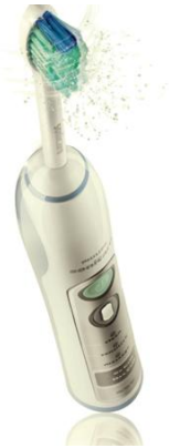
Quality Inside Philips Sonicare